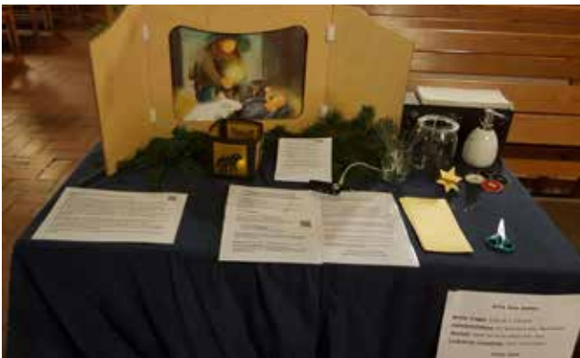
Die interaktive Station zum Hirten Simon

Die Wuselkirche im Dezember – ein Rückblick