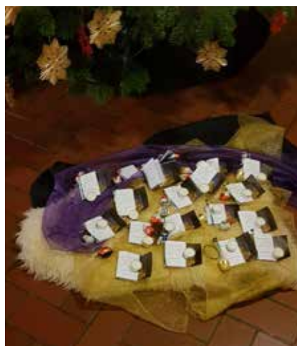
Nicht nur zuhause lagen unter dem Baum Geschenke.